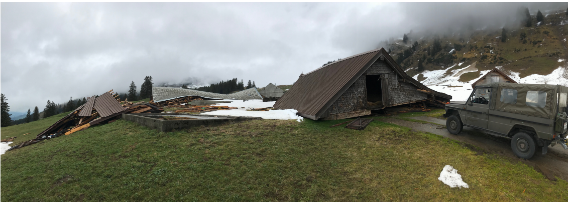
Lawinenschäden Alp Ahorn bei Stein/Nesslau