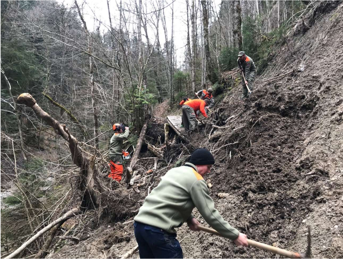
Aufräumarbeiten und Freilegen einer Brücke Feldbachtobel Wattwil